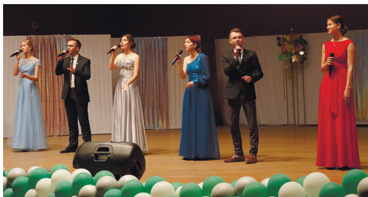
Праздничный концерт, посвященный Дню народного единства

Предстоит еще много работы по реализации всех прогрессивных и амбициозных идей, ведь самый молодой вуз страны находится только в начале своего пути.