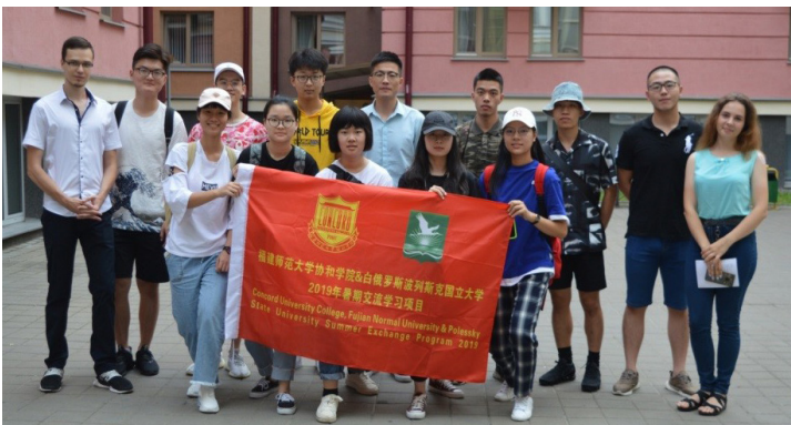
Летняя школа для китайских студентов

ПолесГУ обладает современной материально-технической спортивной базой, позволяющей проводить обучение будущих специалистов в области физической культуры с использованием инновационных технологий на уровне мировых стандартов. Университету принадлежит ведущее место в подготовке квалифицированных специалистов в области физической культуры и спорта в нашем регионе. Факультет организации здорового образа жизни, созданный в ходе реализации инновационного учебно-научно-производственного проекта «Здоровье», подготовил плеяду титулованных выпускников. Сегодня на факультете обучается 1 мастер спорта международного