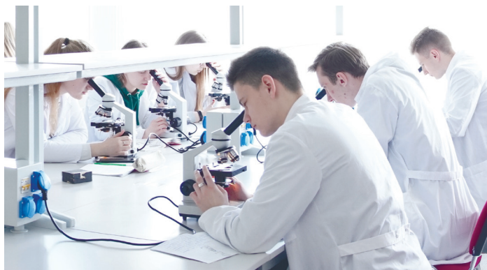
Учебная лаборатория микробиологии

ПолесГУ предусматривает подготовку практико-ориентированных и конкурентоспособных специалистов для внедрения интегрированной системы «студент – образование – наука – производство – бизнес». С этой целью университет на бизнес-площадке ООО «Полесье» проводит мероприятия по созданию инновационной среды (стартап-проект «Пинск-Инвест-Уикенд» и проект «Бизнес-школа»), включающие элементы бизнес-образования для студентов, магистрантов и аспирантов.