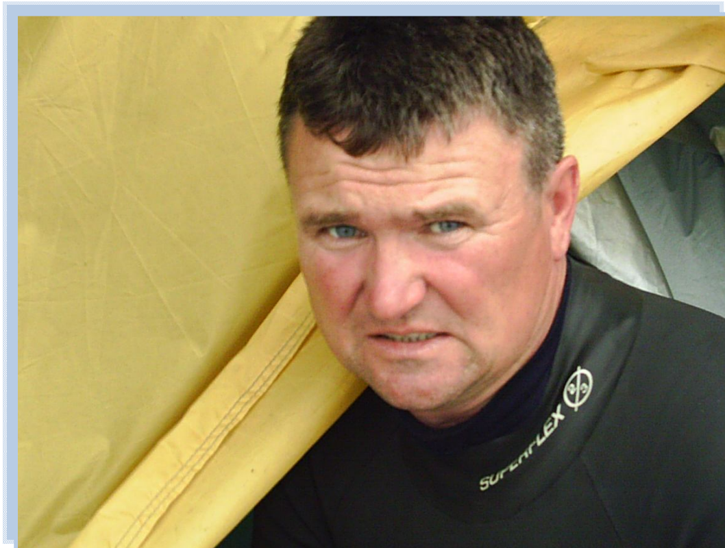
... и на Балтийском море, 2010 г.