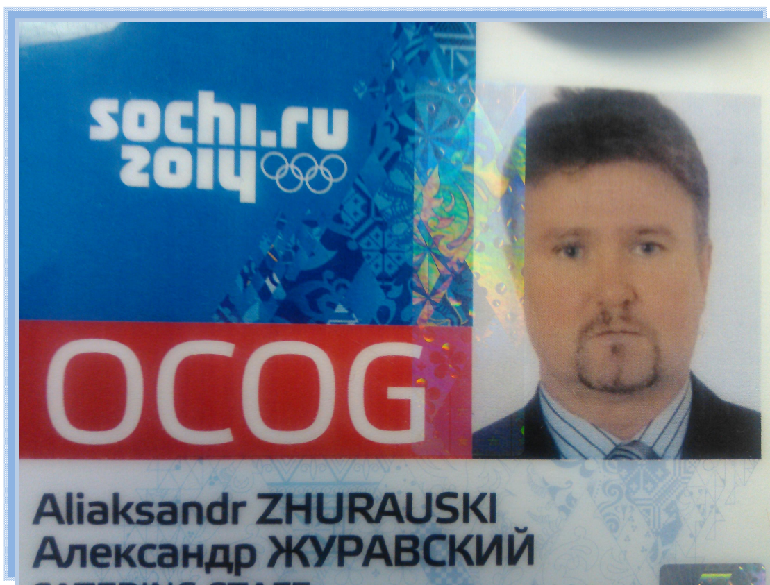
Зимние Олимпийские игры, Сочи, 2014 г.