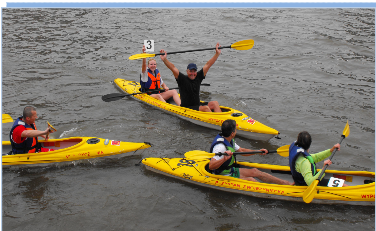
Вроцлав, Всемирные игры поляков, август 2011 г.