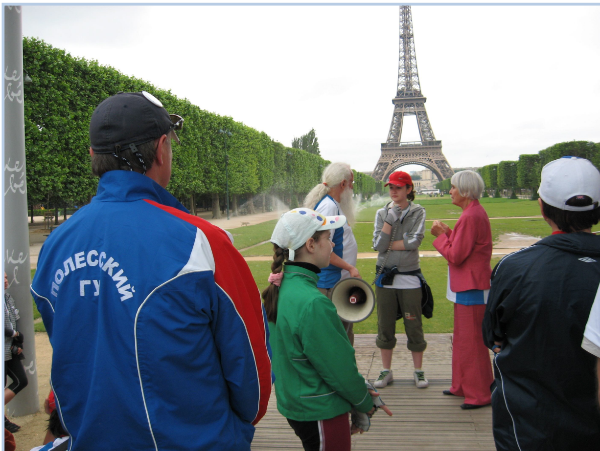
Париж. Старт Международного велопробега “Париж - Москва”, июнь-июль 2008 г.