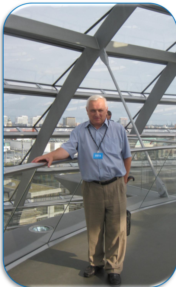
Август 2011 г., Берлин Поездка, организованная Центром международных связей Министерства образования РФ