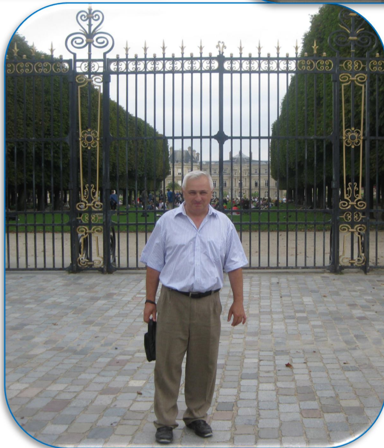
2011 г. Париж